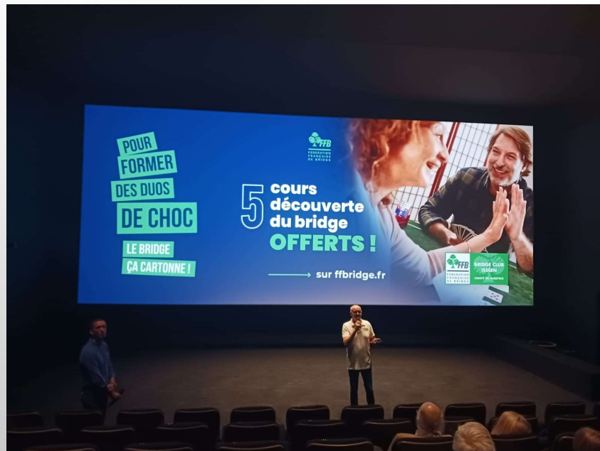
2025 CINÉ PARTAGE À ISSY LES MOULINEAUX